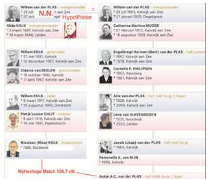
Het onderzoek leidde naar de match tussen Nico Kulk en Aukje van der Plas.

Het complete verslag van deze genealogische speurtocht is onlangs gepubliceerd in het september/oktober nummer (5) van Gens Nostra , een uitgave van de Nederlandse Vereniging voor Genealogie (NGV). Hierin wordt uitvoerig ingegaan in de genetisch genealogische onderbouwing.